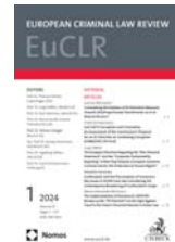
Table of Contents