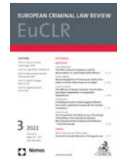
Table of Contents